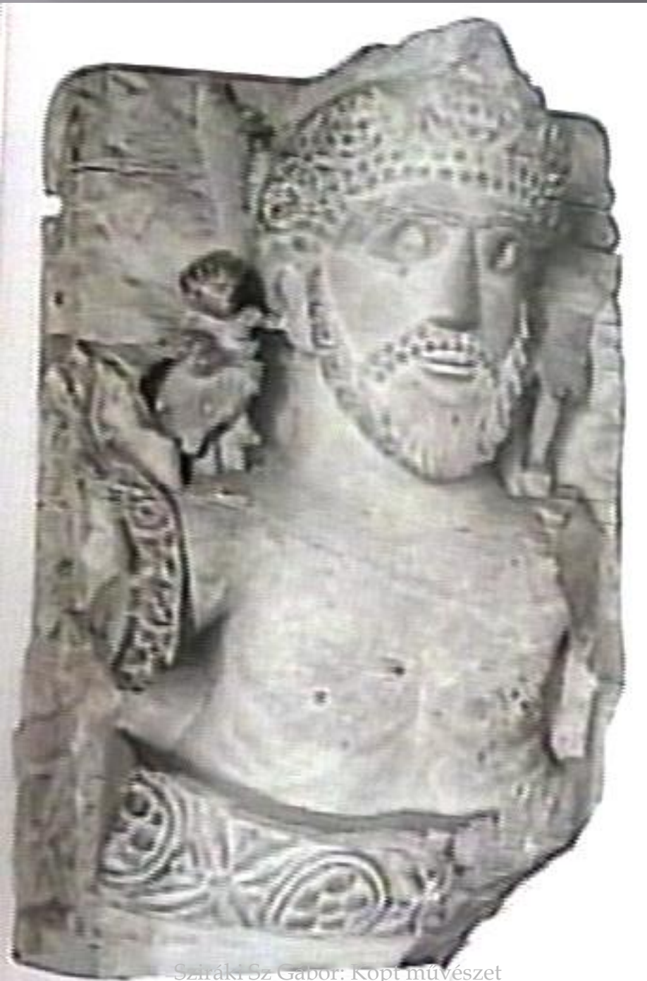
Sziráki Sz Gabor: Kopt művészet