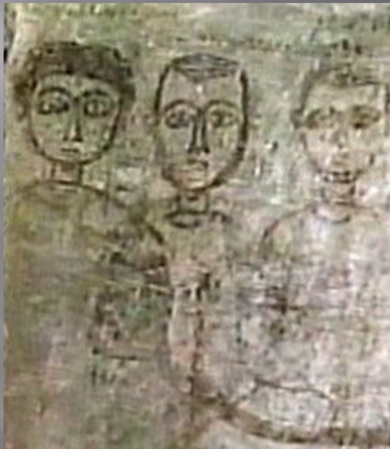
Sziráki Sz Gábor: Kopt művészet