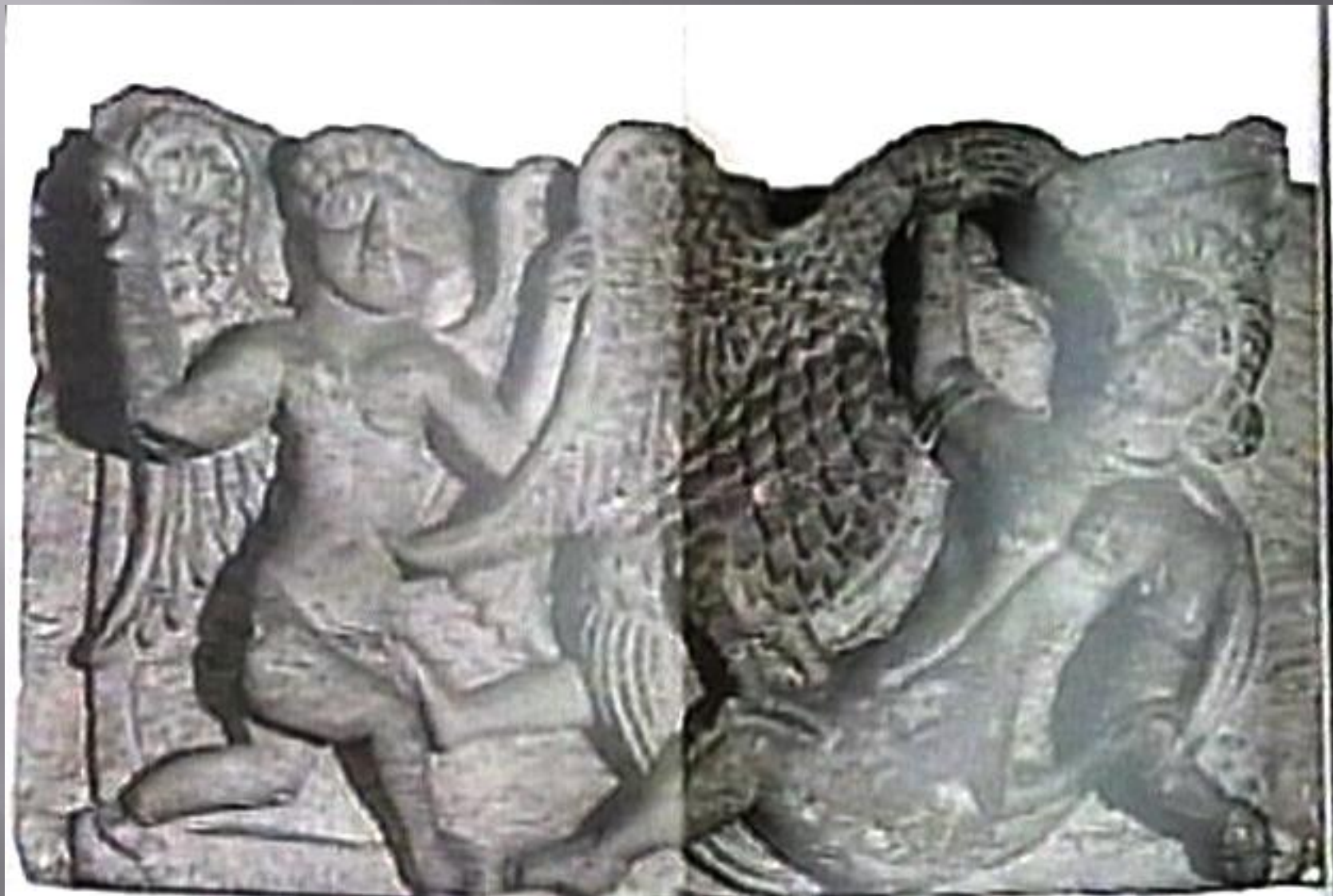
Sziráki Sz Gábor: Kopt művészet