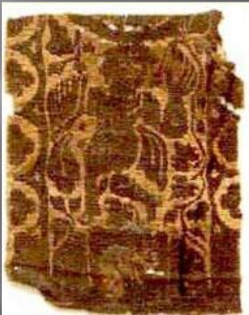
Sziráki Sz Gábor: Kopt művészet