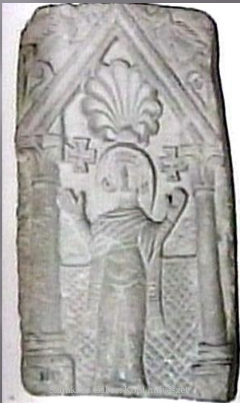
Szirák, Sz. Gábor: Kopt művészet