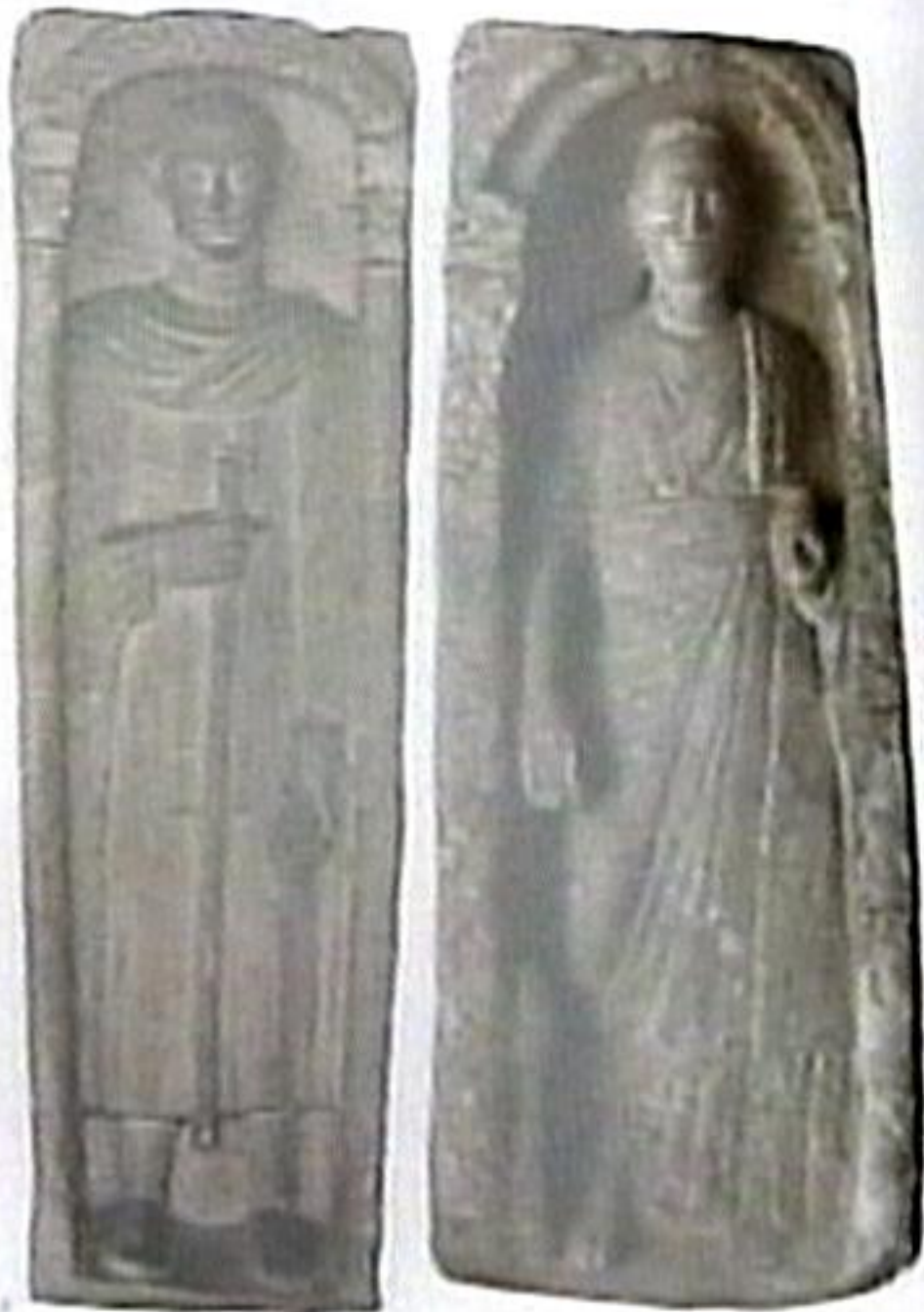
Sziráki Sz Gábor: Kopt művészet