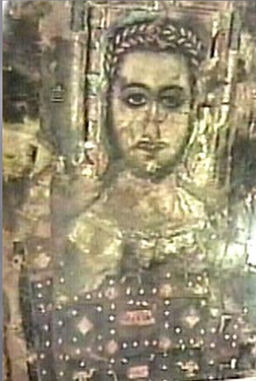
Sziráki Sz Gábor: Kopt művészet