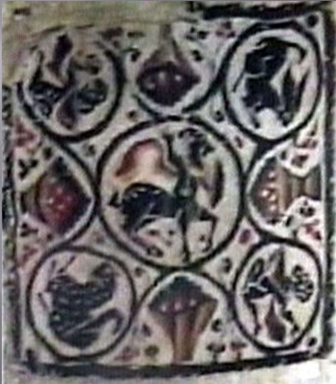
Sziráki Sz Gábor: Kopt művészet