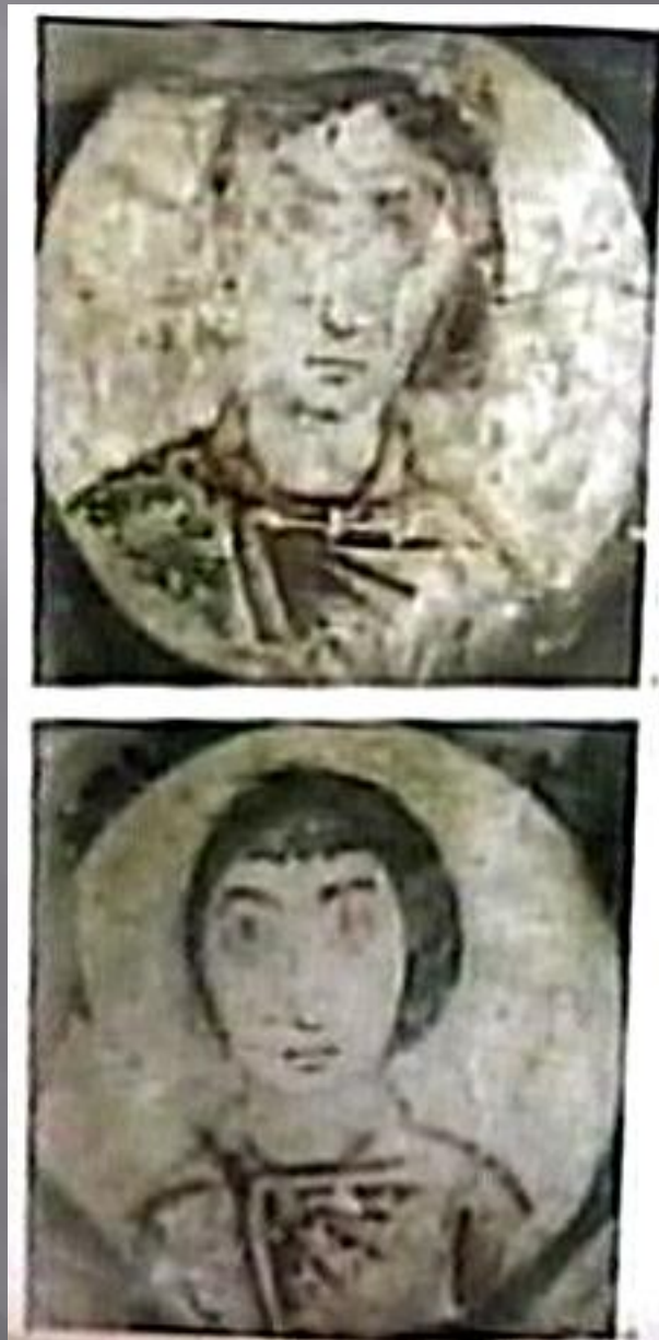
Sziráki Sz Gábor: Kopt művészet