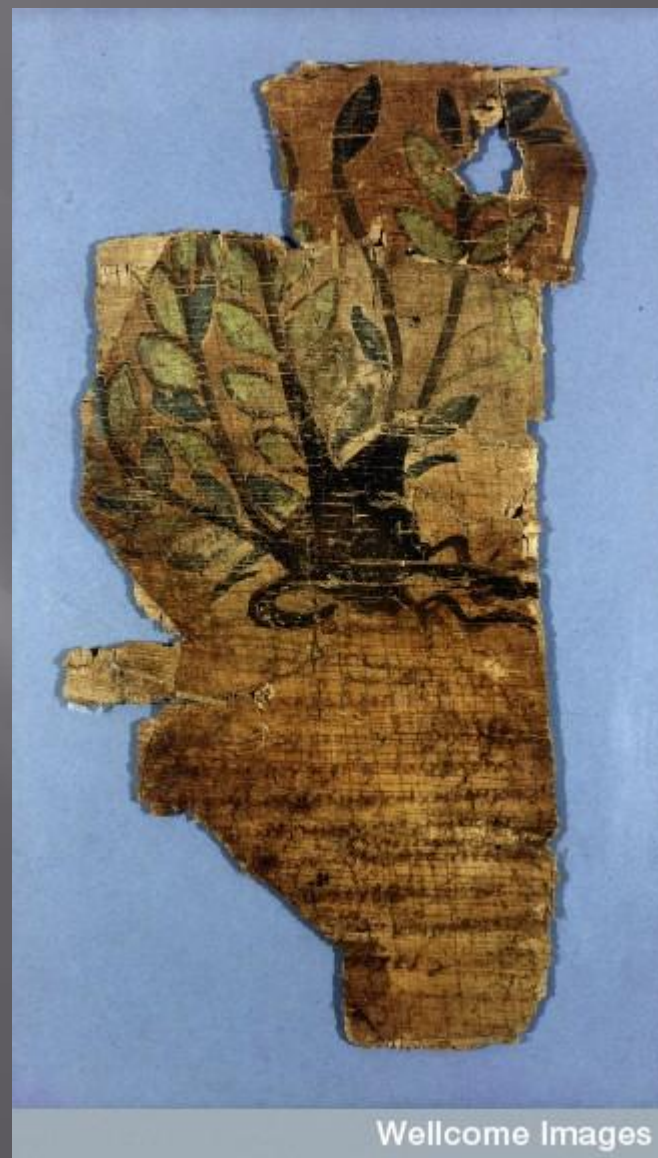
Antinoe textil IV-V. sz.