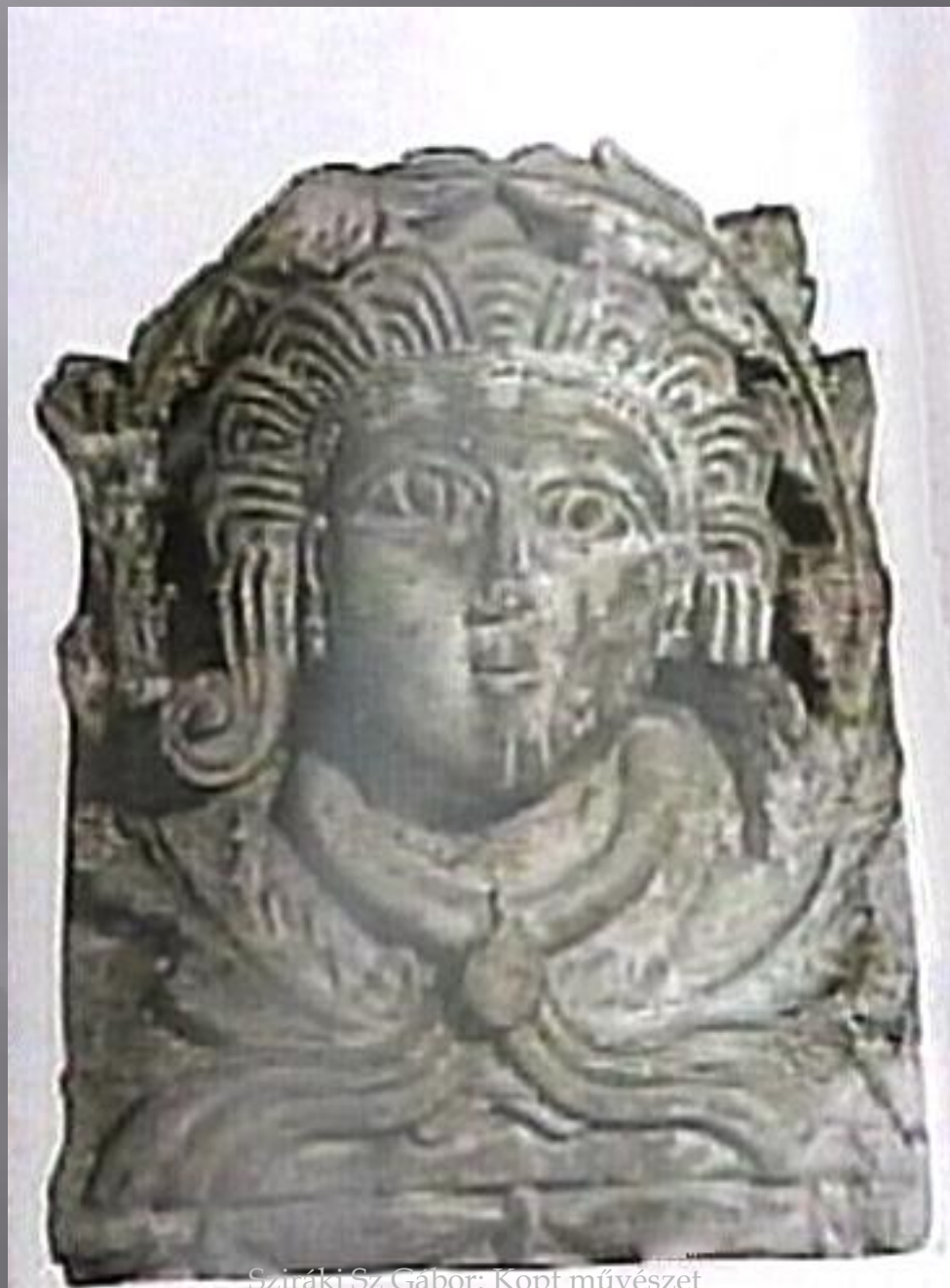
Sziráki Sz Gábor: Kopt művészet