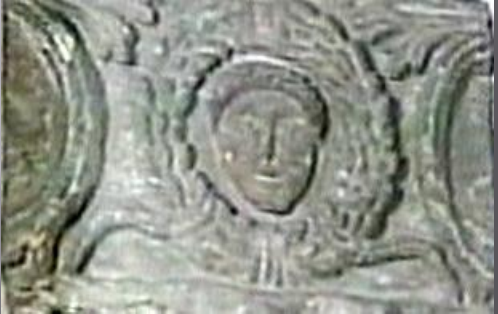
Sziráki Sz Gábor: Kopt művészet