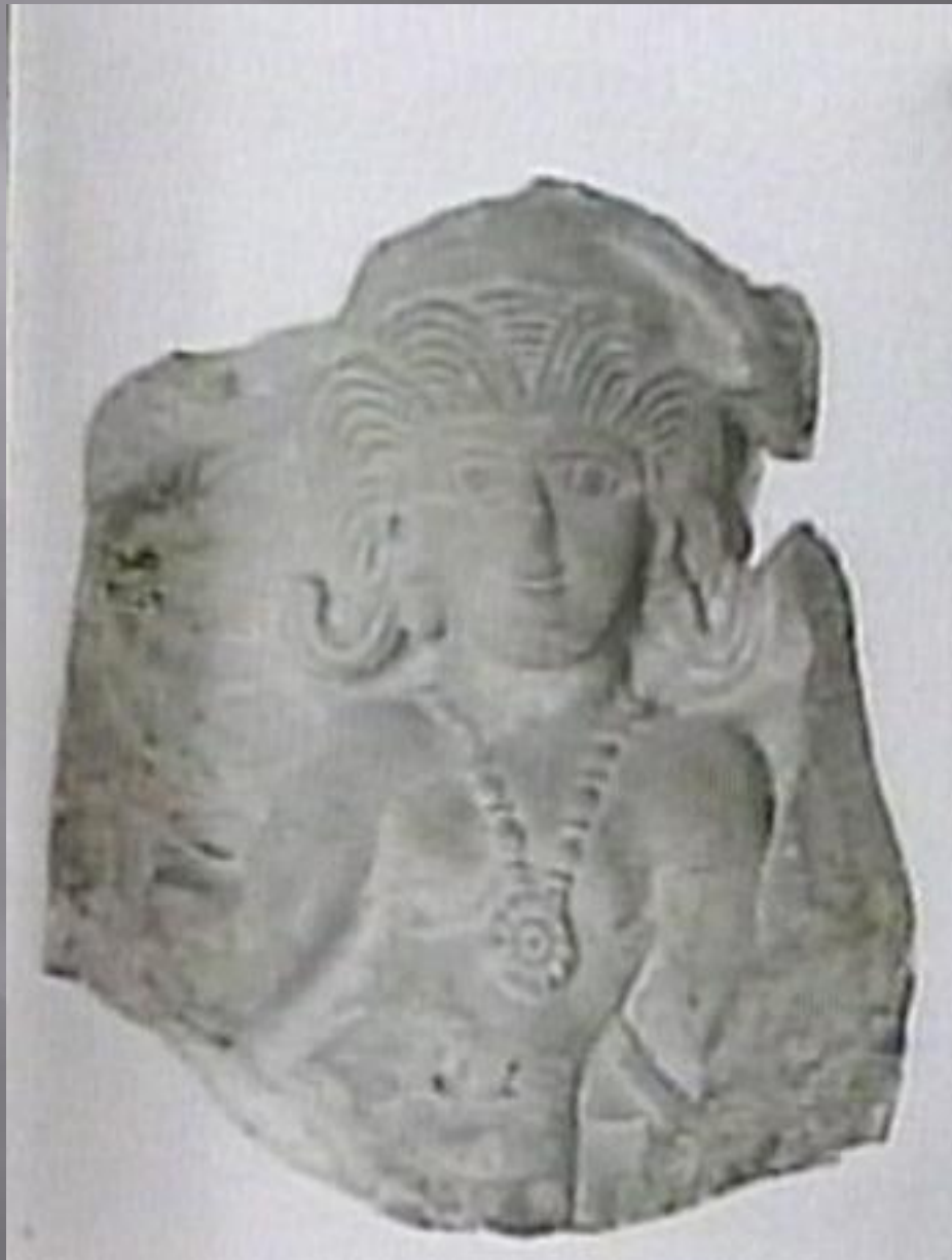
Sziráki Sz Gábor: Kopt művészet