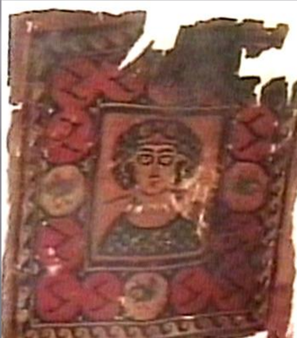
Sziráki Sz Gábor: Kopt művészet