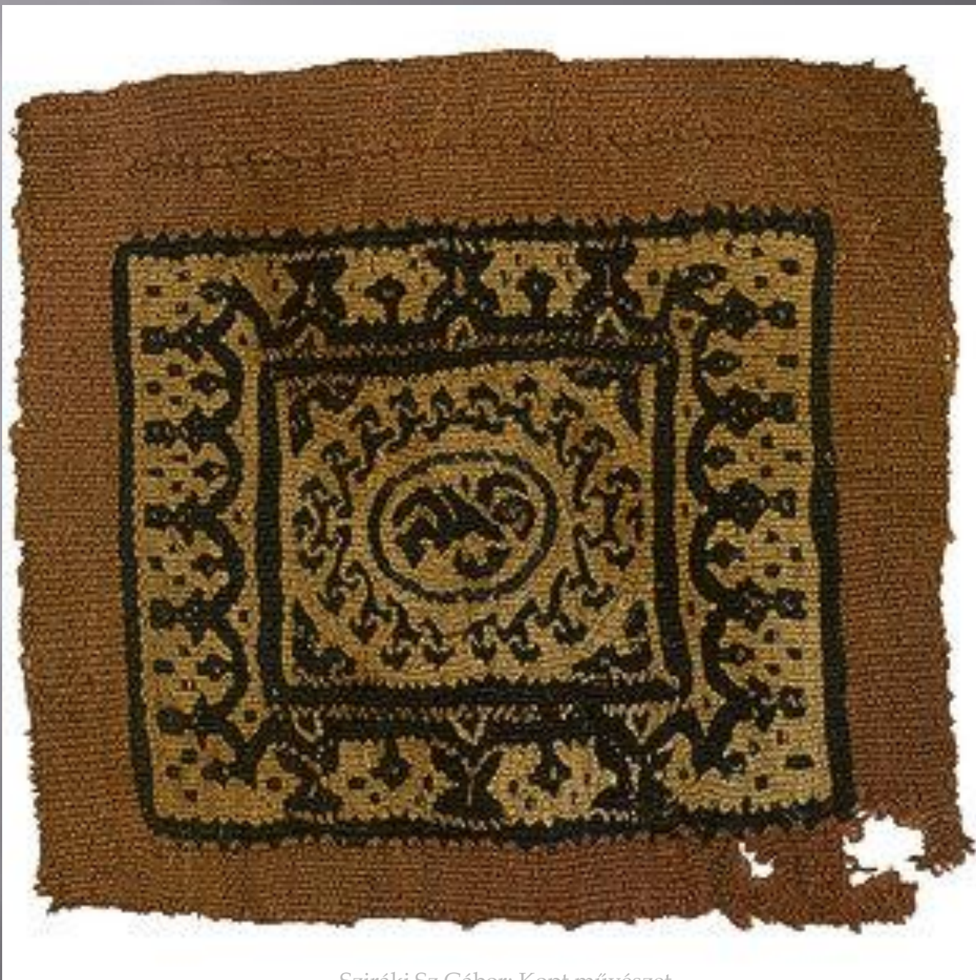
Sziráki Sz Gábor: Kopt művészet