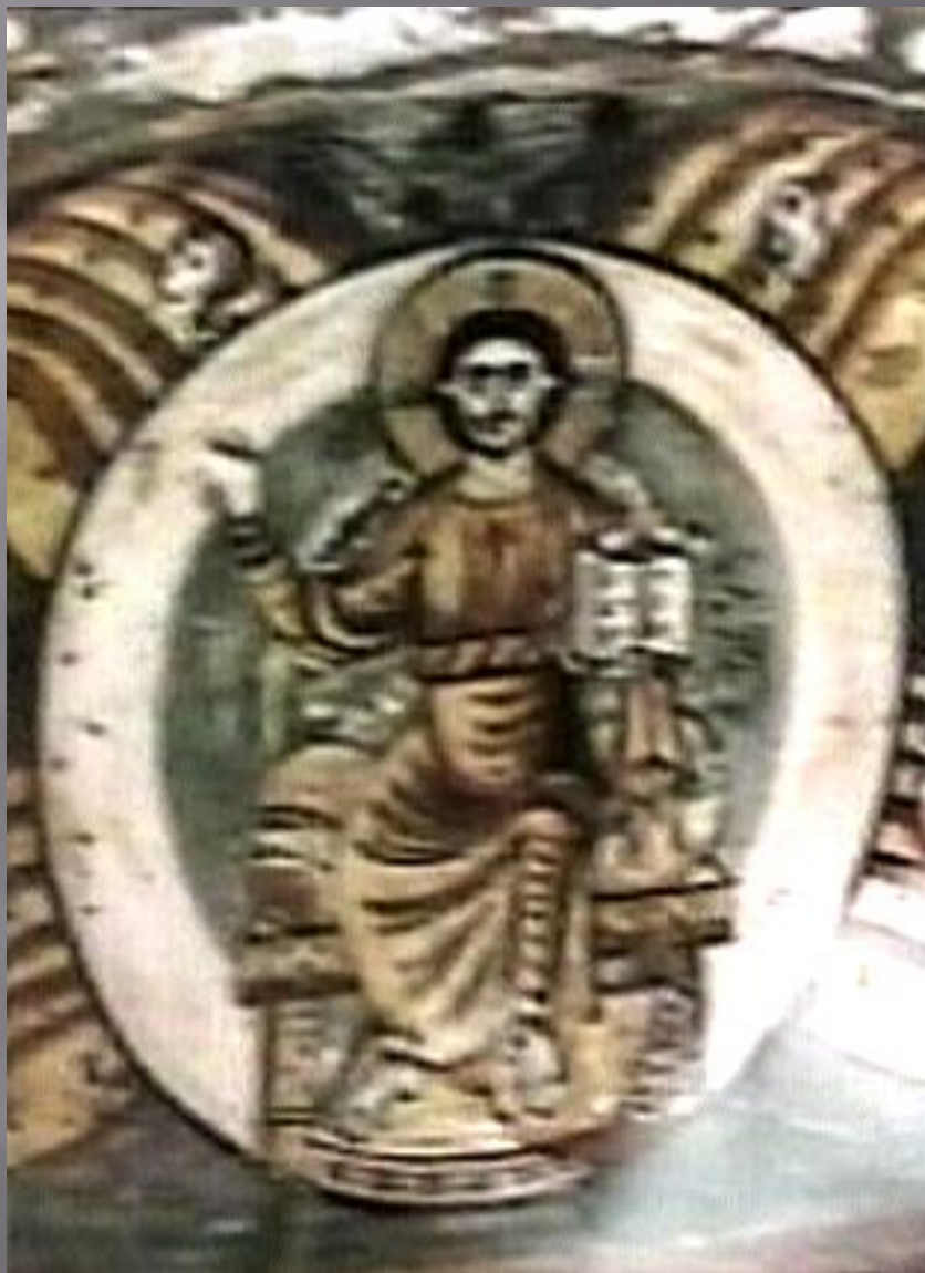
Sziráki Sz Gábor: Kopt művészet