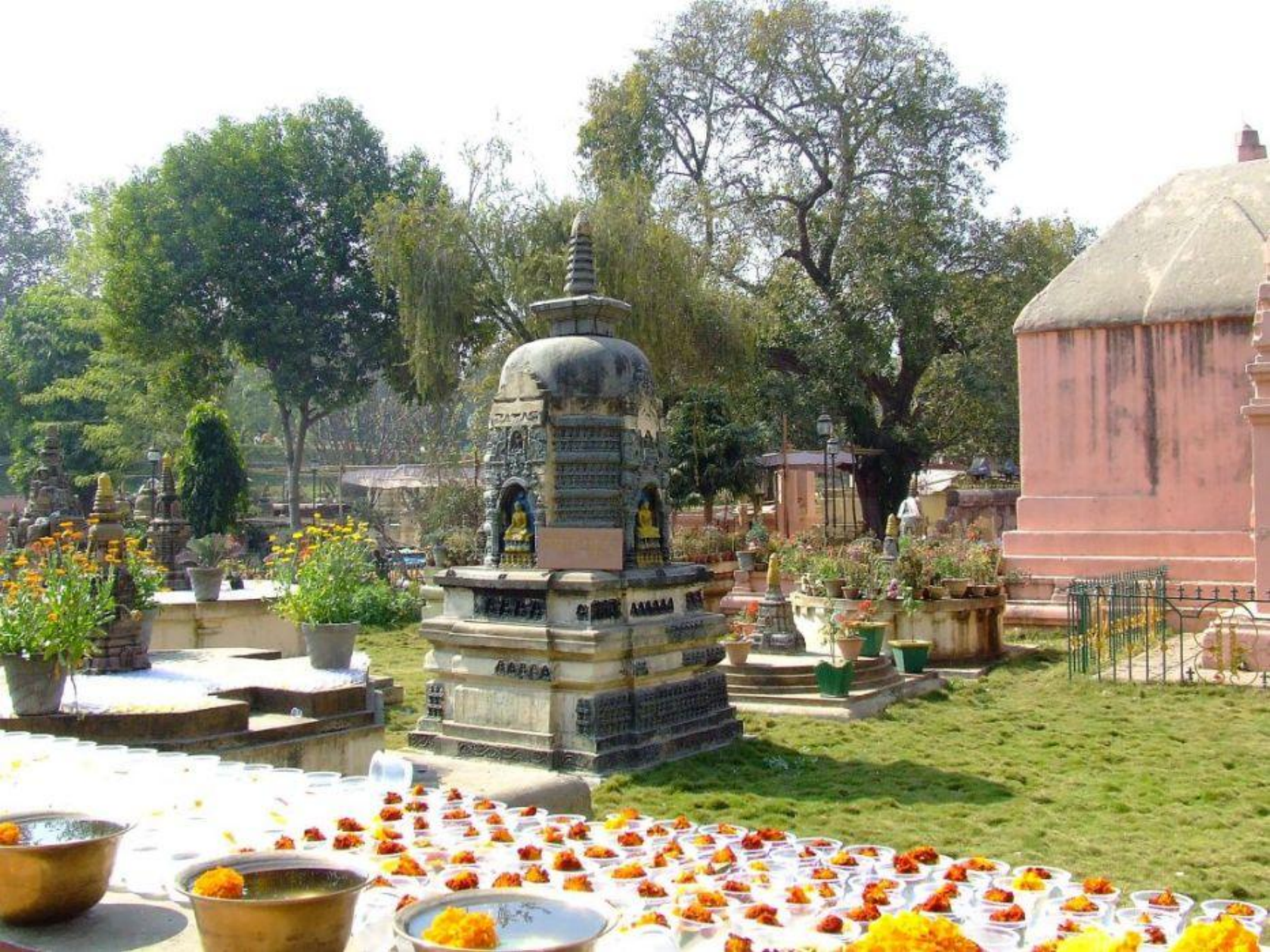
Mahábódhi – Templomudvar részlet Nagy megvilágosodás templomának belső kertje